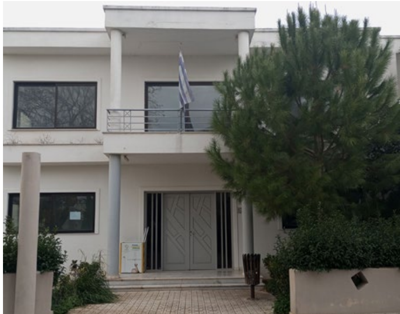
Το κοινοτικό κατάστημα Βοχαϊκού, σύμφωνα με όσα είπε ο Γεν. Γραμματέας του δήμου, θα στεγάσει το Κέντρο Κοινότητας Βέλου-Βόχας

« Όλο αυτό » τόνισε « που είναι δωρεάν, πληρωμένο το κτήριο, το προσωπικό μέσω ΑΣΕΠ με αξιοκρατία, πληρωμένα τα έξοδα μέσω ΕΣΠΑ, όλο αυτό ξέρετε γιατί χάθηκε; Γιατί κανένας δεν κατέθεσε το φάκελο! Γιατί τον Ιούλιο η Περιφέρεια τους πίεζε, η διαχειριστική αρχή καταθέστε τον φάκελο. Και δεν