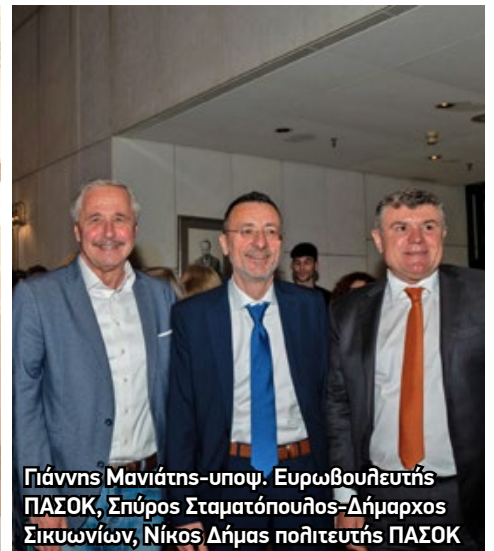
Γιάννης Μανιάτης-υποψ. Ευρωβουλευτής ΠΑΣΟΚ, Σπύρος Σταματόπουλος-Δήμαρχος Σικυωνίων, Νίκος Δήμας πολιτευτής ΠΑΣΟΚ